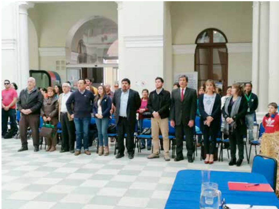
Autoridades y asistentes al encuentro de baile en la Gobernación Provincial de Los Andes.