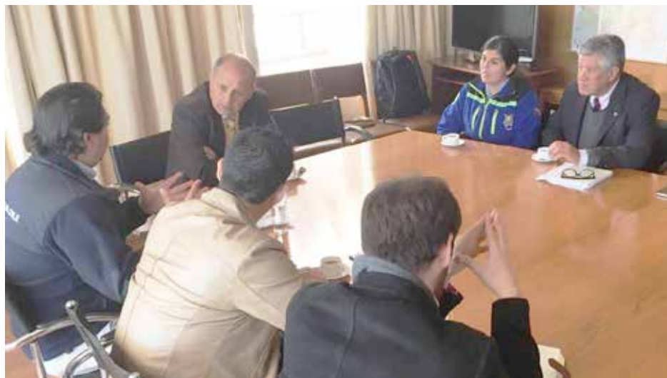
La reunión sostenida por los representantes de Aconcagua con el Intendente Gabriel Aldoney.