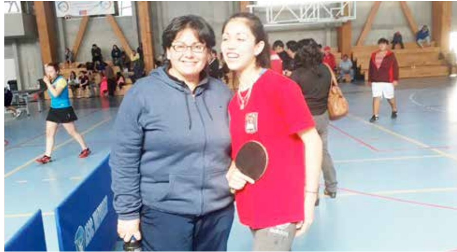
Un inédito tercer lugar regional en tenis de mesa escolar para Los Andes.