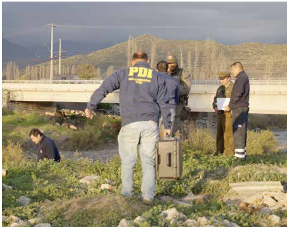
La presencia policial y del Servicio Médico Legal en la ribera sur del río Aconcagua, al poniente del puente David García.

De acuerdo a los antecedentes recabados en el lugar por El Andino, dicho hallazgo lo efectuó alrededor de las 17:30 horas una persona en situación de calle que vive bajo el viaducto, quien vio pasar el cuerpo arrastrado por la corriente y que fue a auxiliarlo por cuanto a la distancia observó que aparentemente