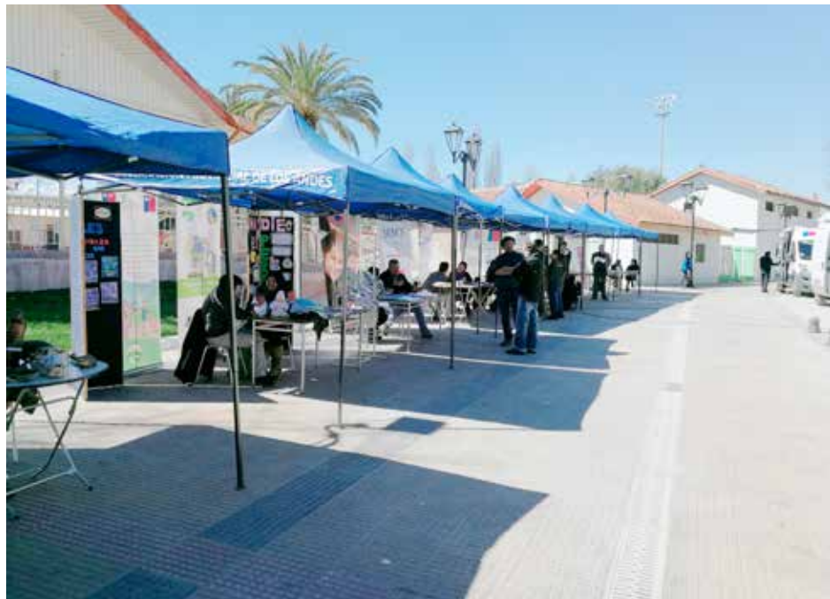
Nuevamente se llevó a cabo el programa Gobierno Presente, ahora en la comuna callelarga.

y Protección Social de la Gobernación de Los Andes.