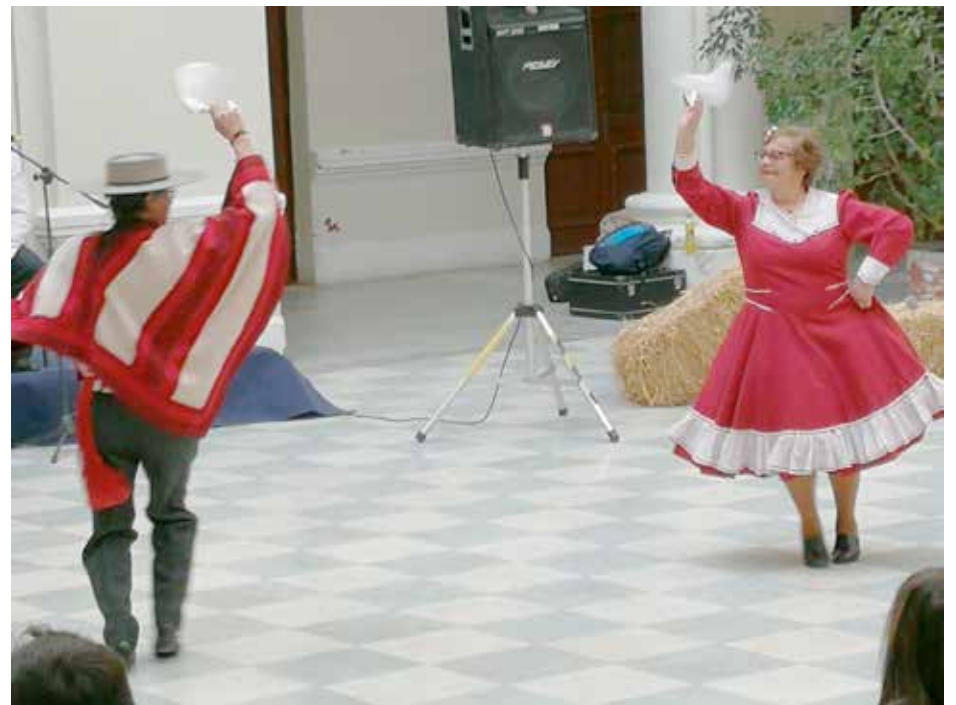
Los participantes demuestran sus habilidades en la pista de baile.

El gobernador provincial de Los Andes, Daniel Zamorano Vargas, destacó la participación de los adultos mayores indicando que "estamos haciendo una actividad que demuestra a la sociedad el envejecimiento activo, importante, grande, con participación y organización social, donde se eligió a la pareja de cuequeros que representará a la provincia en el regional de cueca. Nosotros queremos mostrar a la sociedad así al adulto mayor, participativo, activo, con ganas de seguir bailando cueca".