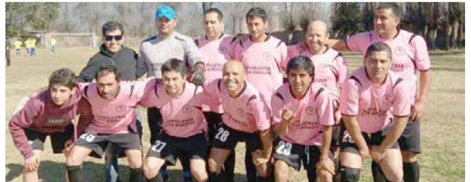
San Marco Campeón del primer torneo del año del Agrusela.

2 La próxima jornada del certamen de la Agrupación Senior de Los Andes, en su temporada 2017, se jugará este sábado 9 de septiembre.