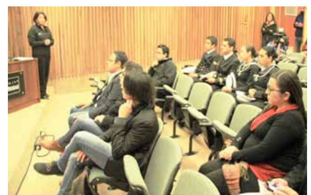
La XXIII Semana Nacional de la Ciencia y la Tecnología, iniciativa organizada por el Programa Asociativo Regional (PAR) de Explora CONICYT Valparaíso, se realizará del 1 al 8 de octubre próximo.

y le Tecnología comenzarán el domingo 1 de octubre a las 20 horas en la Plaza de Armas de Quillota, con una invitación a sumergirse en un nuevo mundo a través de una intervención urbana de luces, colores y sonidos referente a los Océanos, tema del año 2017 en Explora CONICYT, y culminarán el sábado 7 de octubre con la denominada "Fiesta de la Ciencia", actividad masiva que se realizará desde las 10:00 horas en el Jardín Botánico Nacional ubicado en el sector El Salto de Viña del Mar, y que contará con más de 50 actividades para