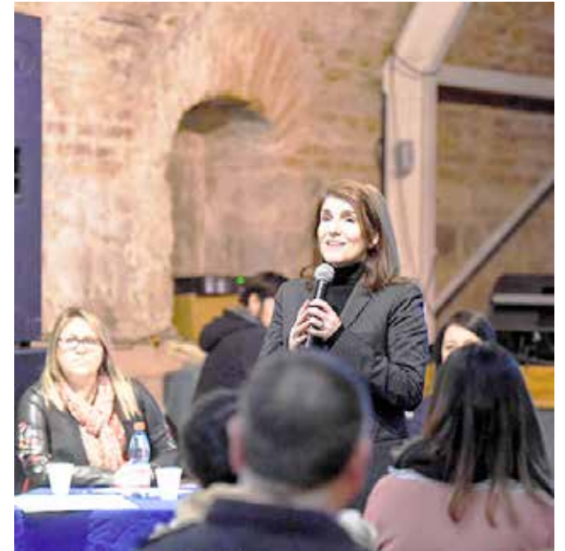
Paula Narváez, Ministra Secretaria General de Gobierno.

En relación a los dichos de la Coordinadora Arauco-Malleco (CAM), en los que aseguraron que el llamado conflicto mapuche "se va a mantener", la ministra Paula Narváez fue enfática en aclarar que para el Gobierno "no es la violencia la manera de resolver los problemas, no lo ha sido nunca y no lo va a ser", agregando que "este Gobierno jamás va a suscribir ningún mecanismo que reivindique la violencia. Estamos por el diálogo y estamos porque Chile frente a esto se una y pueda dialogar al más alto nivel, con todas las comunidades, con todos