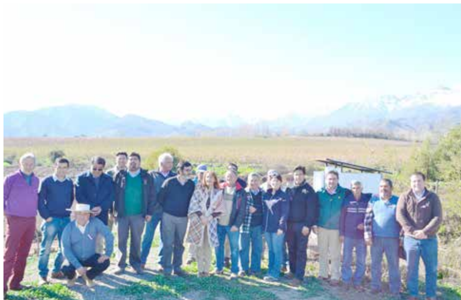
Los campesinos de las comunas de Calle Larga y San Esteban están felices y orgullosos por el logro del proyecto.

Cabe destacar que entre los principales objetivos de ambos proyectos está el dar seguridad hídrica para el riego, tanto en vides como