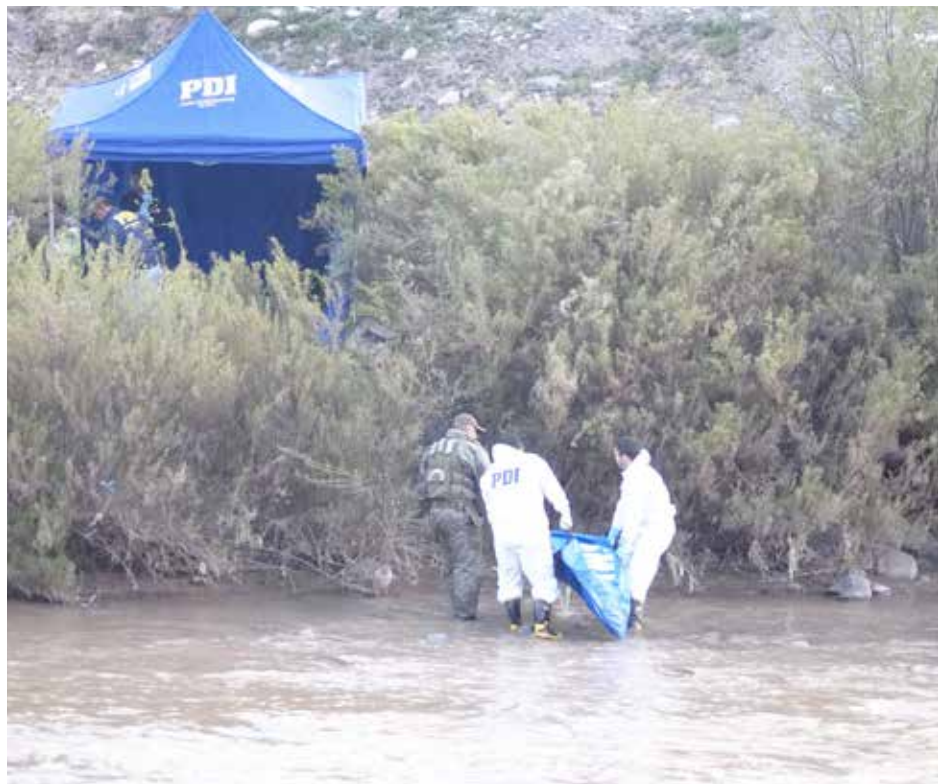
El retiro del cuerpo desde el agua para ser sometido a los peritajes policiales.