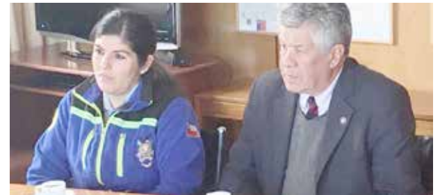
El nuevo cuartel es un proyecto emblemático para las provincias de Los Andes y San Felipe. Destacan voluntad del intendente por la obra.

El core Vargas, en tanto, dijo que si bien los fondos debieran pensarse para el próximo Gobierno Regional, "con soluciones acordadas es más fácil pensar que proyecto se pueda convertir en realidad, porque este complejo tiene características muy especiales, el manejo de químicos y de situaciones difíciles, lo que lo hacen muy relevante ante el colapso que afecta a los cuerpos de Bomberos en las ciudades". Por lo mismo, dijo "esto hay que tomarlo con esperanza y altura de miras, para dar tranquilidad a la población y capacitar a los voluntarios".