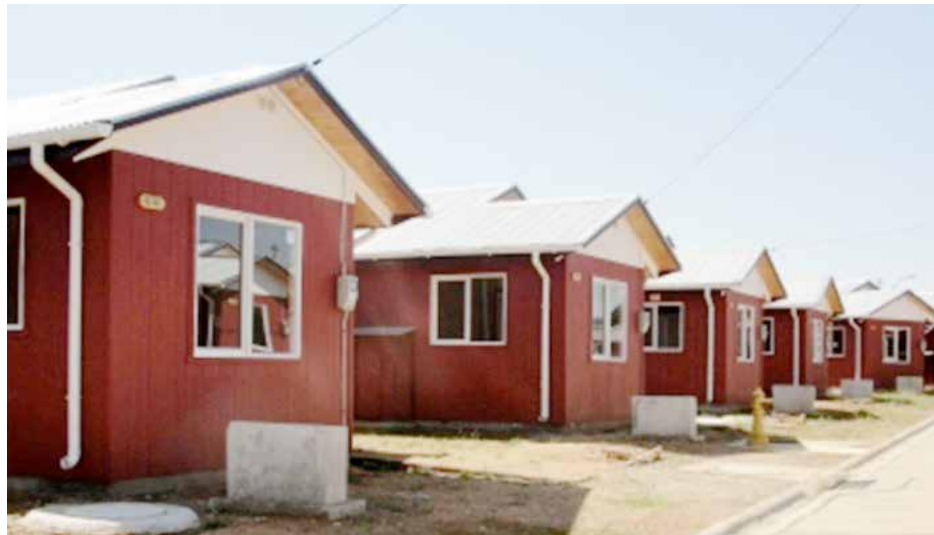
Los postulantes deben cumplir con los requisitos que estipula la ley.

Un total de 495 subsidios dispuso el Ministerio de Vivienda y Urbanismo en la región, en el marco del segundo llamado del año del Programa Sectores Medios y Emergentes, Decreto Supremo DS01, destinado para quienes no cuenten con una propiedad.