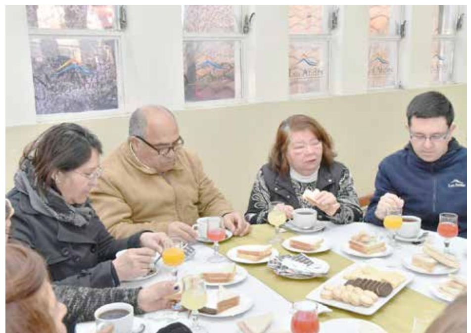
Los beneficiados disfrutan de un desayuno en la entrega de subsidios.