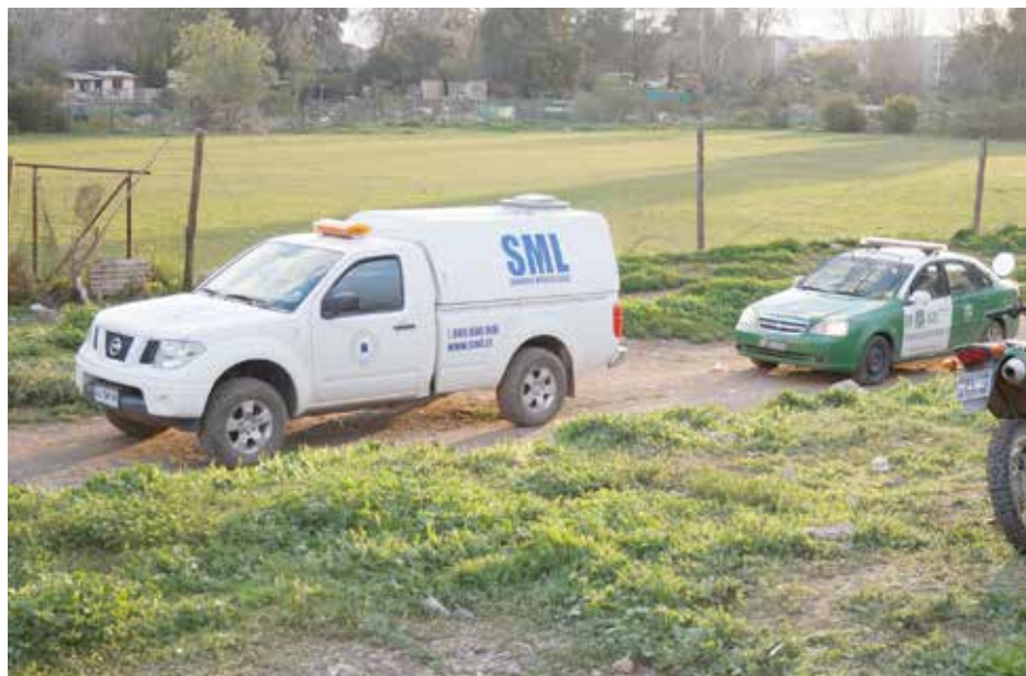
La autopsia permitirá establecer la causa precisa de la muerte del hombre.