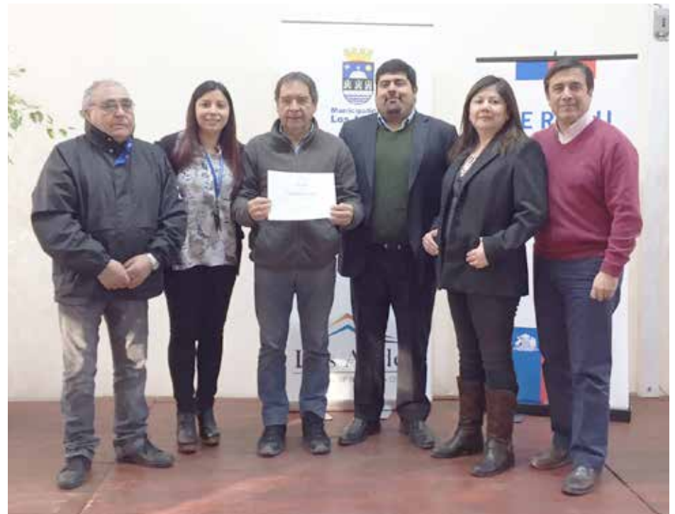
Las autoridades provinciales junto a beneficiarios del programa.

AMOR: Ojo con convertirte en juez y verdugo ya que un error puede cometer lo cualquiera. SALUD: Esta con mucho estrés y es preferible que no conduzca por hoy, prefiera cualquier otro método de transporte. DINERO: No se deje estar. Salga a buscar el éxito. COLOR: Rosado. NÚMERO: 12.