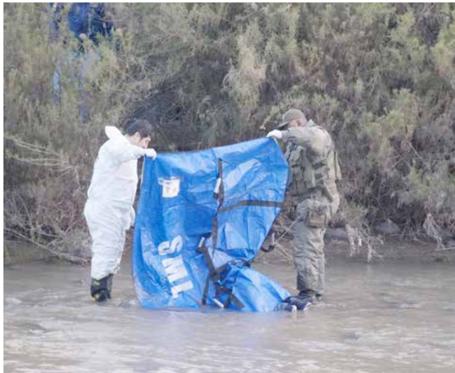
Funcionarios de la Brigada de Homicidios de la PDI Los Andes y de la Tenencia San Esteban efectúan la revisión del cuerpo que yace en el lecho del río.

se encontraba con vida, sin embargo al intentar salvarlo comprobó que estaba muerto.