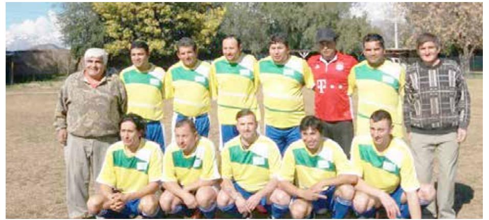
Lukas Gym comenzó ganando en el Clausura.