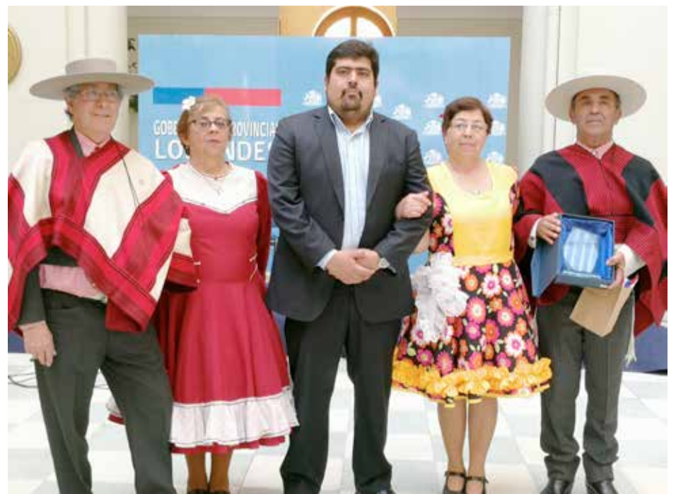
El gobernador junto a los ganadores del evento.