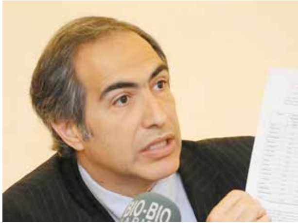
Senador Francisco Chahuán.

El senador Francisco Chahuán manifestó la necesidad de realizar un estudio epidemiológico que establezca por qué las comunas de Los Andes, Puchuncaví y San Antonio concentran los más altos porcentajes de muertes de personas en listas de espera para ser atendidos por patologías AUGE y llamó a generar un nuevo sistema infor-